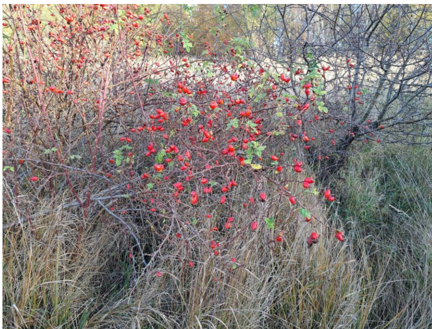
Ryc. 7. Róża psia rosnąca w centralnej części badanego terenu.

Wszystkie wymienione rośliny są pospolite w skali kraju i regionu, nie podlegają ochronie oraz nie są wykazywane w Polskiej Czerwonej Księdze.