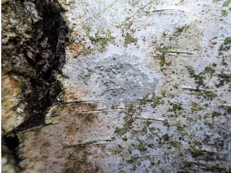
Ryc. 6. Misecznica grabowa na pniu drzewa.

Misecznica grabowa Lecanora carpinea – grzyb lichenizujący (porost). Występuje na korze drzew. Rozpowszechniony w całym kraju (Wójciak 2007).