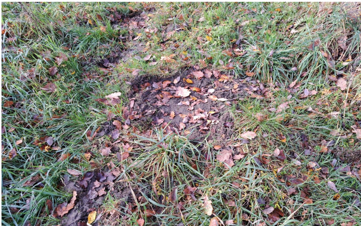
Ryc. 4. Teren zryty przez dziki w poszukiwaniu pokarmu.

Dzik eurazjatycki Sus scrofa – gatunek łowny. Na terenie planowanego przedsięwzięcia obserwowano bytność 4-7 osobników. Gatunek pospolity w skali kraju i regionu ( https://www.iop.krakow.pl/Ssaki/ ).