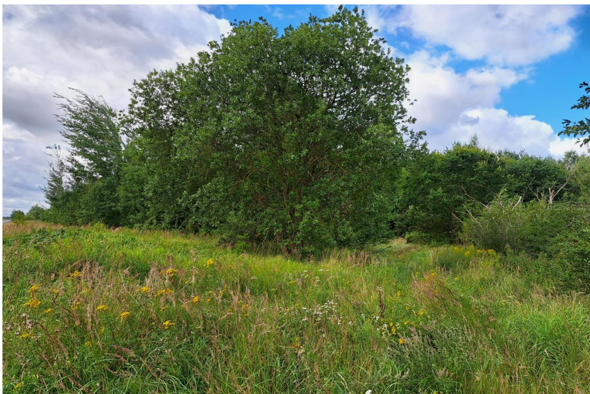
Ryc. 2. Widok terenu planowanego przedsięwzięcia – część wschodnia.

Inwentaryzacja przyrodnicza działek Nr 1/11 i 25/33, obręb ewidencyjny Nr 0007,