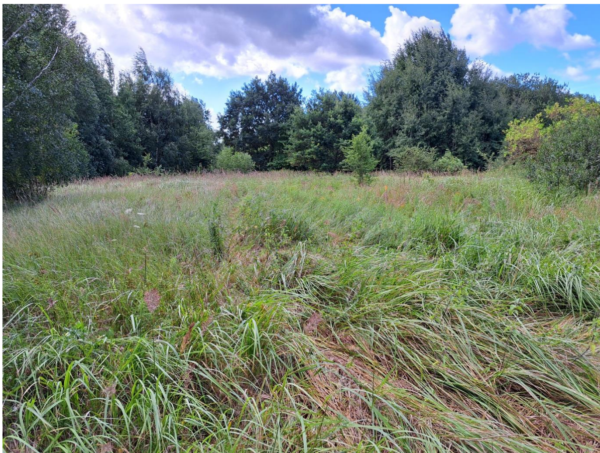
Ryc. 3. Widok terenu planowanego przedsięwzięcia – część północna.

Otoczenie terenu planowanego przedsięwzięcia, to obszary umiarkowanie zagospodarowane – hale magazynowe, zakłady produkcyjne, drogi (w tym droga szybkiego ruchu), utwardzone place oraz zabudowujące się nieużytki.