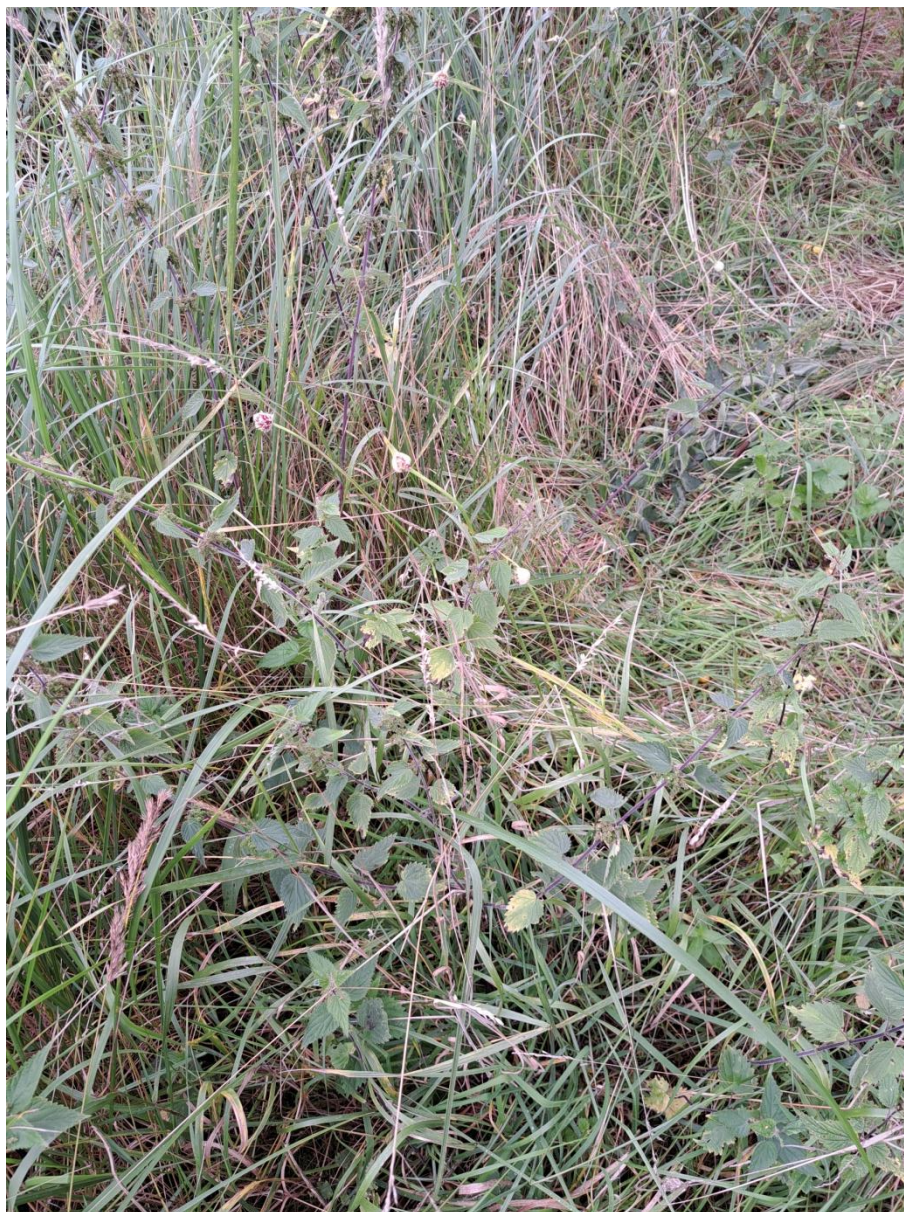
Ryc. 9. Czosnek pospolity – relikw starych upraw.