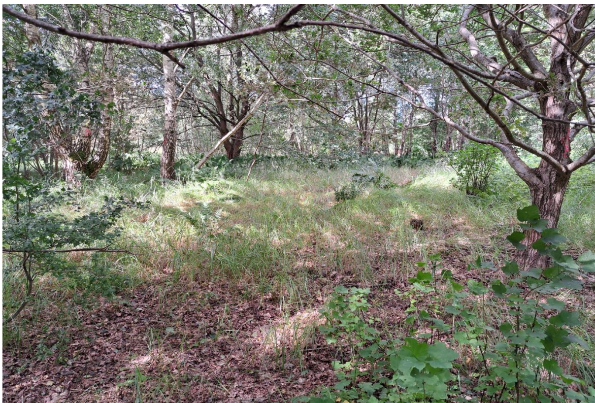
Ryc. 1. Widok terenu planowanego przedsięwzięcia – część centralna.